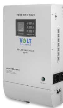
SinusPRO S 7000 48V