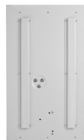
SinusPRO S 7000 48V