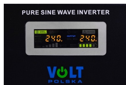
sinusPRO 2000W 24V