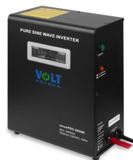
sinusPRO 2000W 24V